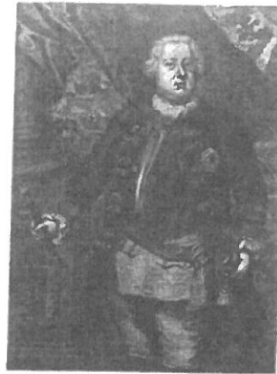
Preußenkönig Friedrich Wilhelm I.

Im Jahr 1717 wollte Friedrich Wilhelm I, König von Preußen, alle Kinder in seinem Land in die Schule schicken. Dort sollten sie lesen, schreiben und rechnen lernen. Doch seine Minister waren dagegen: „Die Kinder sollen 5 arbeiten, nicht in die Schule gehen“, meinten sie. Sie fanden Friedrich Wilhelms Idee unnötig 2 und viel zu teuer. Heute ist es selbstverständlich 3 , dass Jungen und Mädchen in die Schule gehen. Mindestens 4 neun Jahre lang müssen alle Kinder in 10 Deutschland, Österreich und der Schweiz eine Schule besuchen. Danach gehen sie freiwillig 5 in eine weiterführende Schule oder sie beginnen eine Berufsausbildung. Die Ausbildungszeit wird immer länger. „Wenn man verheiratet ist, dann ist man erwachsen“, hieß eine alte 15 Regel. Vor 50 Jahren heirateten junge Menschen mit durchschnittlich 22 Jahren. Heute heiratet man im Durchschnitt acht bis elf Jahre später. Bedeutet das auch, dass junge Menschen heute später erwachsen werden?