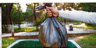
den Müll / Abfall raus|bringen