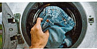
die Wäsche waschen