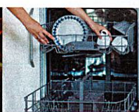
die Spülmaschine ausräumen