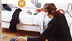
das Zimmer auf|räumen