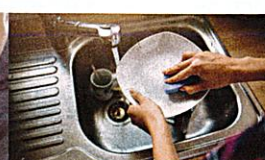
das Geschirr abwaschen