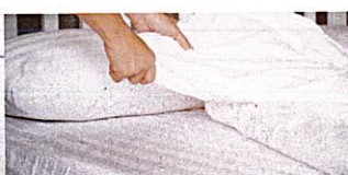
das Bett machen