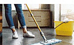
den Boden wischen