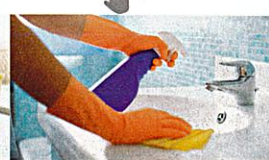
das Bad putzen