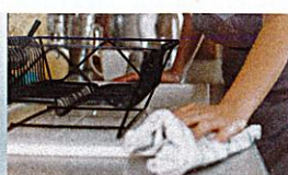
die Küche sauber machen