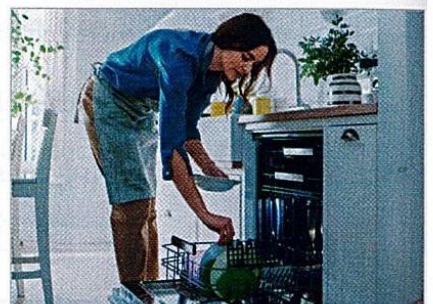
Spülmaschine einräumen und ausräumen