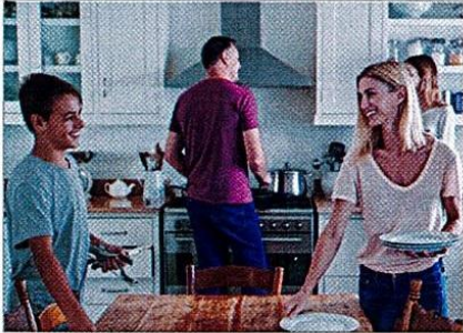
Tisch decken und abdecken

Spülmaschine einräumen und ausräumen • Müll wegbringen • Fenster putzen • Blumen gießen • Bad putzen • Tisch decken und abdecken • Staub wischen • staubsaugen • bügeln • Wäsche waschen • aufräumen • Boden wischen