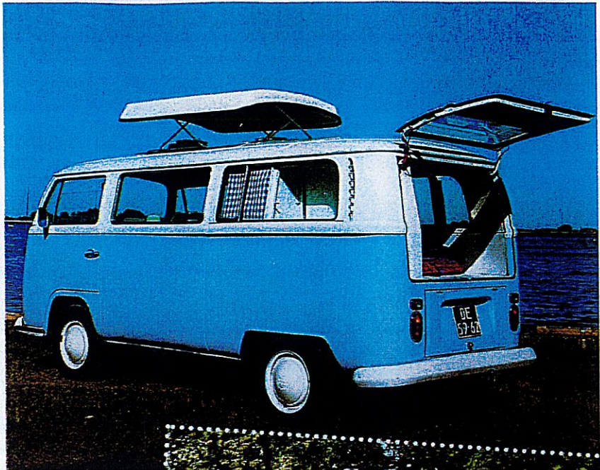
Mit einem Camper kann man spontan an den schönsten Orten übernachten – direkt am Meer, am See oder im Wald.

5 Beim Schreiben dieser Gründe habe ich nun noch mehr Lust